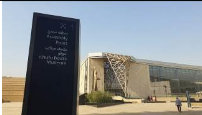
太陽の船の博物館