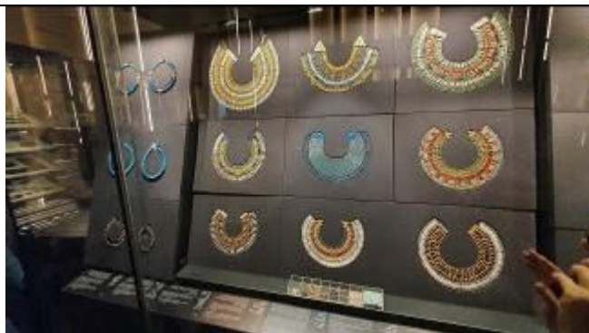
ビーズ模様のネックレス