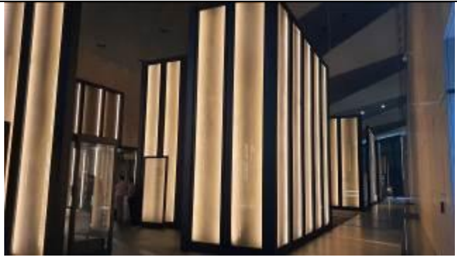
ツタンカーメンギャラリーの外側