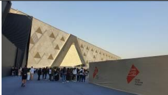
グランドオープンセレモニーで使われた場所の囲い