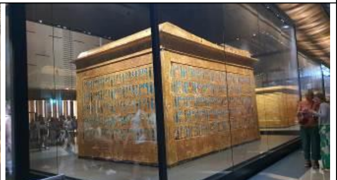
金張りの一番大きな厨子。その後に小さい厨子