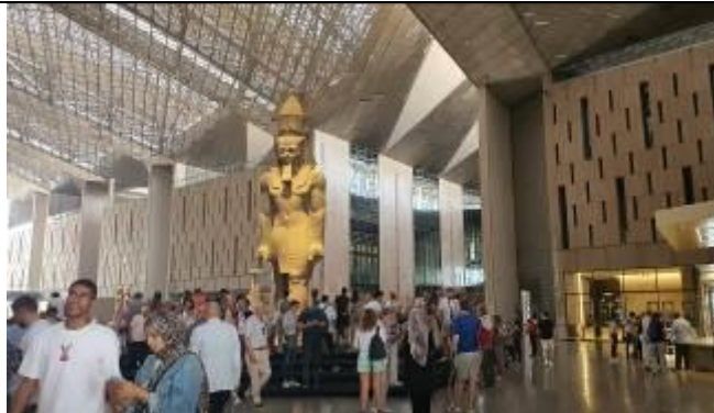
8 時半過ぎこの辺りまで入ることが可能。