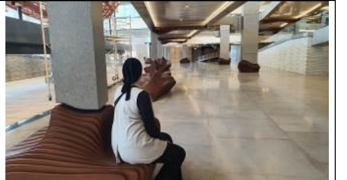
1階にはおしゃれな座る場所が設置