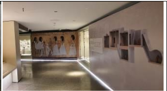
デールエルメディーナで発掘されたものが展示されている