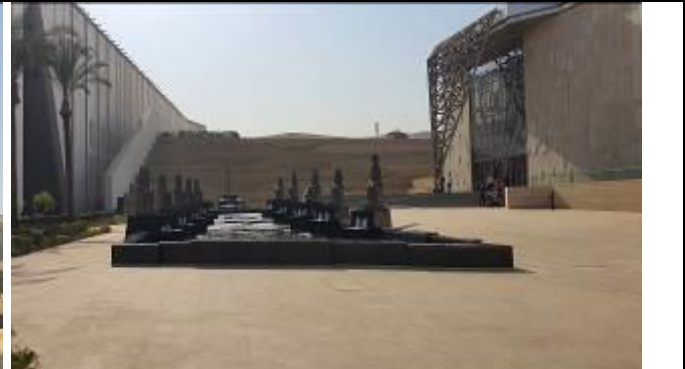
博物館前—ナイル川をイメージしたオブジェ