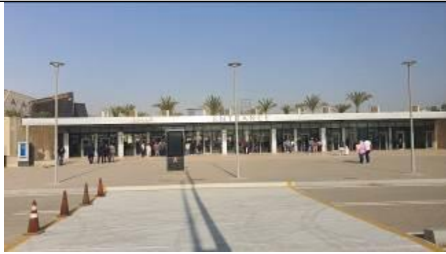
駐車場から入口へ

大エジプト博物館のグランドオープン一般公開が、本日 11 月 4 日より始まりました。それに合わせて本日視察へ行ってきました。博物館では、10 万点以上の展示品が並び、ツタンカーメン王の展示物には、それぞれに日本語で説明が記載されていました。グランドステアを上がり、右にツタンカーメン王の展示物、左にメインギャラリーがありますが、メインギャラリーの一部より通路を渡ってツタンカーメン王ギャラリーに入ります。かなりの観光客で混んでおりました。個人使用であれば、カメラ、携帯電話での撮影は可能です。フラッシュ不可。商業用に使用不可。