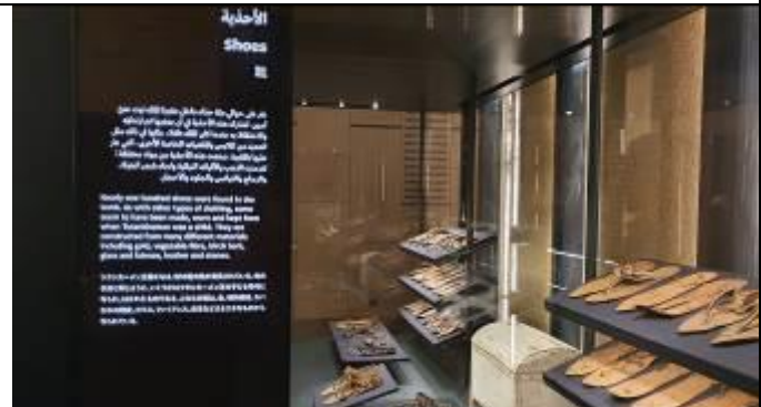
ツタンカーメン王のわらじ