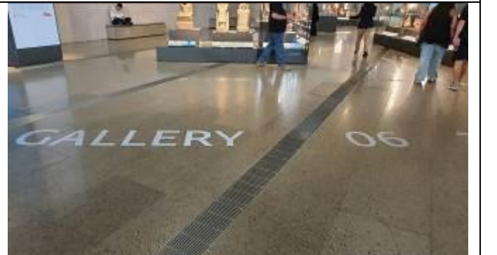
床にギャラリー番号が表示されるようになった