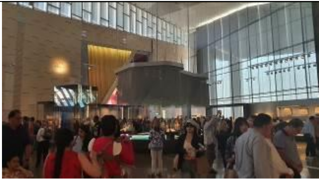
メインギャラリー