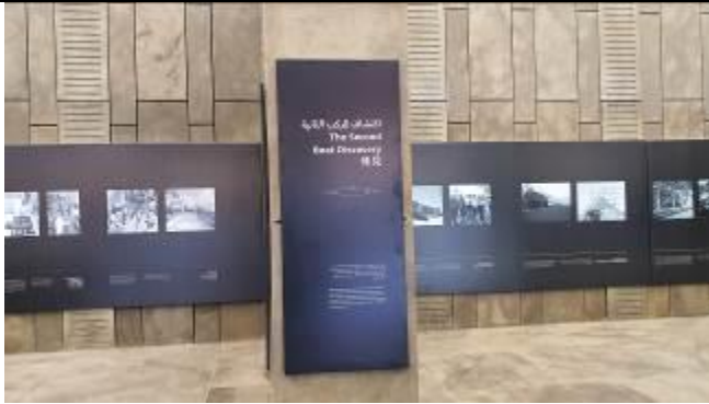
第2の太陽の船の発見時の様子など