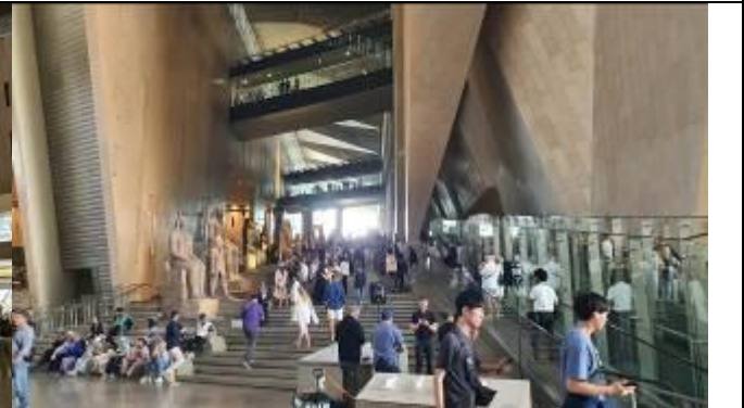
9 時よりグランドステアから入ることが可能