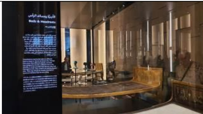
それぞれの展示品に日本語で説明