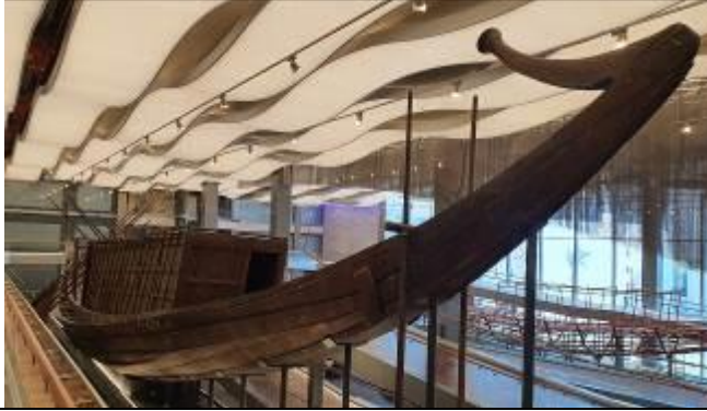
太陽の船-螺旋階段3階より