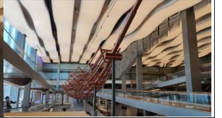
太陽の船の模型-恐らくのちに第2の太陽の船が入る