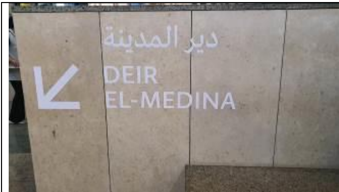
地下にデールエルメディナの展示品