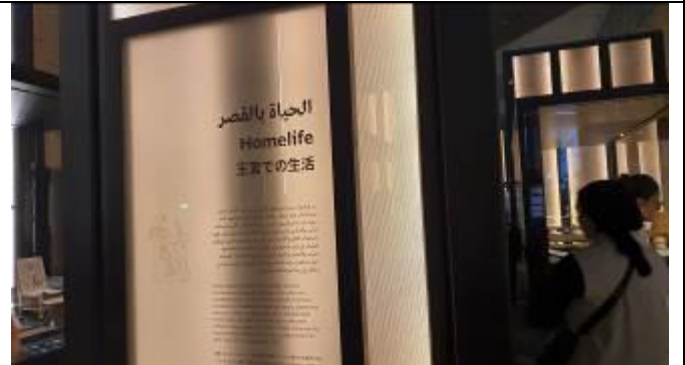
それぞれテーマによって展示品を分別