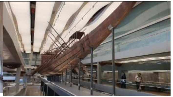
太陽の船 - 螺旋階段2階より