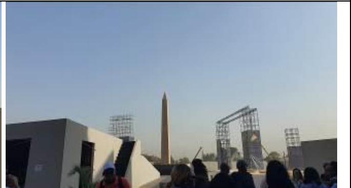
グランドオープンセレモニーで使われたステージ