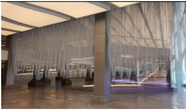
建物に入った入り口