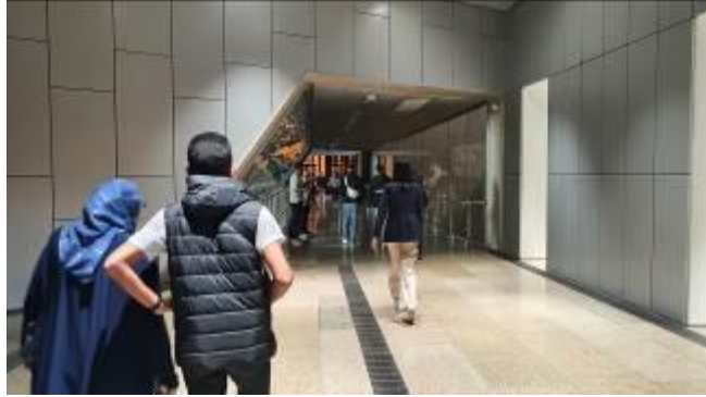
通路をとってツタンカーメン王のギャラリーへ