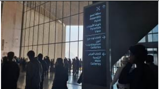
グランドステアを上り詰めた場所(奥にはピラミッド見える)