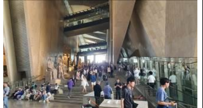
写真上部に二つの通路。ツタンカーメンギャラリーに繋がる